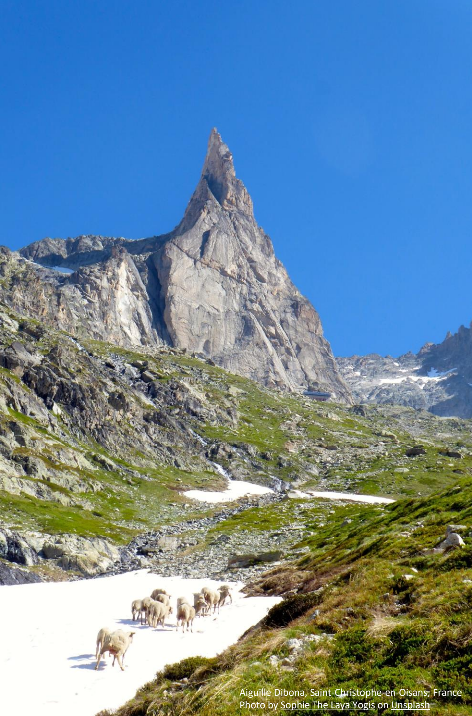
Aiguille Dibona, Saint-Christophe-en-Oisans, France